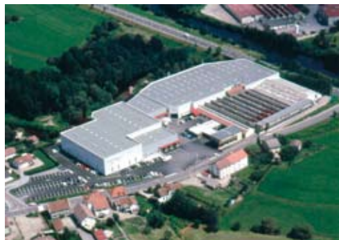
Produktionsenhet i Frankrike

Vi på Aerfast vet att vi har bra lösningar till bra priser. Vi samarbetar med de bästa maskinbyggarna i landet samt att vår produktionsenhet i Frankrike kan kundpassa maskiner & verktyg så att det passar era användningsområden. Vi tror också att våra kunder vill ha det bästa produkterna med mest kostnadseffektiv lösning.