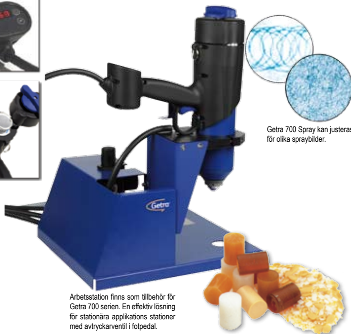
Getra 700 Spray kan justeras för olika spraybilder.