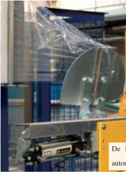
De klem brengt de folie automatisch aan de palet aan