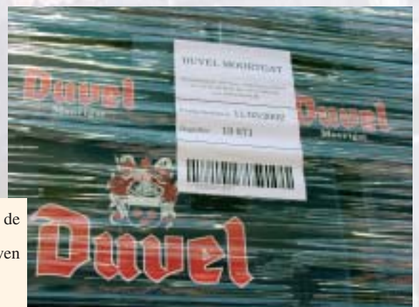
Door het etiket op de folie te kleven blijven de kratten proper