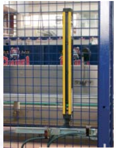
Muting : samen met het veiligheidshekken waarborgt dit veiligheidssysteem geen onvoorziene toetredingen in de installatie