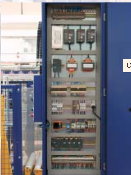
Overzichtelijke en ruime kast