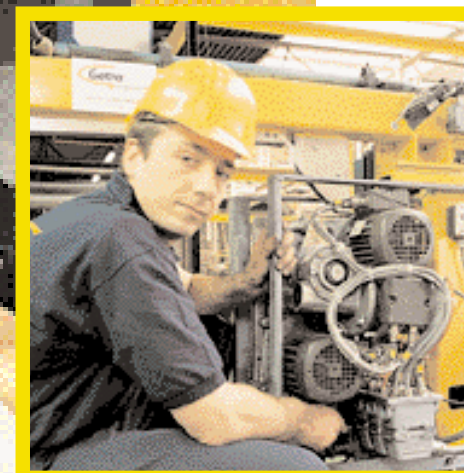
Onze ervaren Getra technici voeren op vastgelegde tijdstippen preventief onderhoud uit.