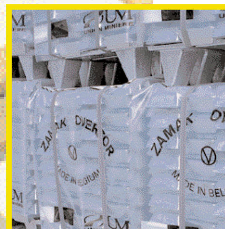
Iedere pallet wordt voorzien van een plastic hoes en vervolgens twee keer omsnoerd.