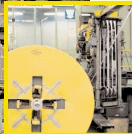
De jumbo-coil afroller met zwenkarm voor de toevoer van de staalband geeft een bijzonder grote autonomie aan de machine.