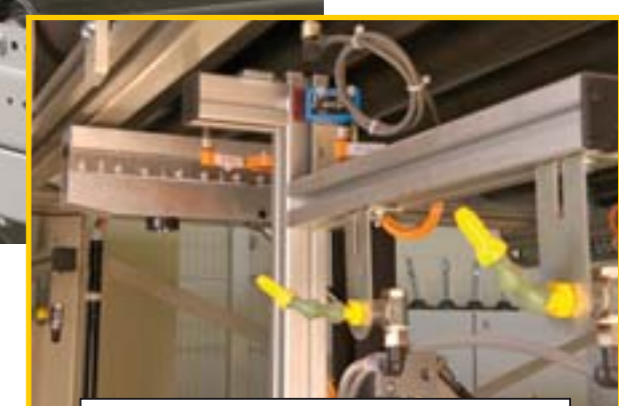
Afsnij-unit en folie aanblaassysteem