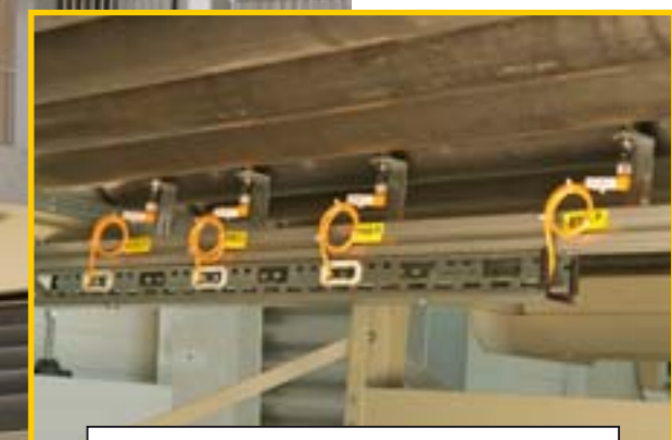
Automatische breedtemeting pakket