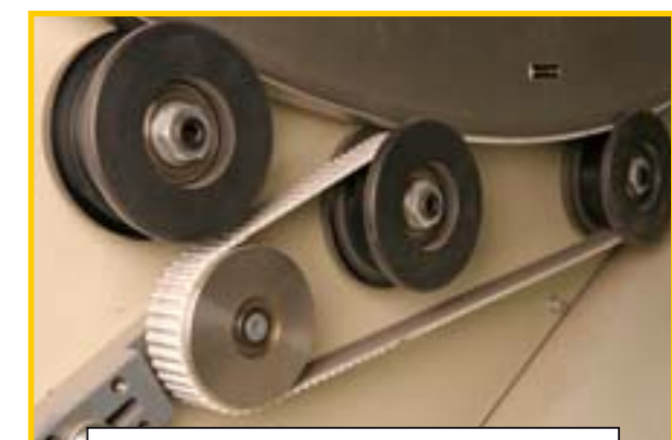
Solide aandrijving van de wikkelring