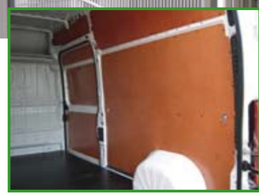
Geïnstalleerde vloeren en wanden