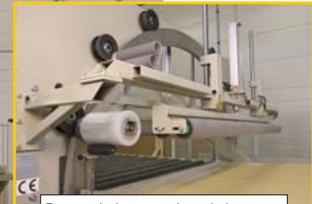
Pneumatisch gestuurd aandruksysteem