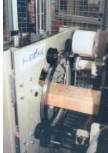
De Junior/S-450 VA is een standaardmachine voor het automatisch verpakken van producten met een diagonaal tot 400mm. De lengte is onbeperkt.