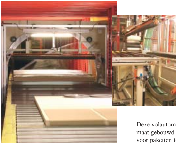
Deze volautomatische installatie werd op maat gebouwd en kan gebruikt worden voor pakketten tot 2 m breed.