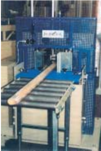
De BSB-45 SX-2 is een standaardmachine voor het halfautomatisch verpakken van producten met een diagonaal tot 400mm. De lengte is onbeperkt.

Voor meer inlichtingen kan u terecht bij Ludo Van de Poel, productspecialist : tel 03/355.03.36.